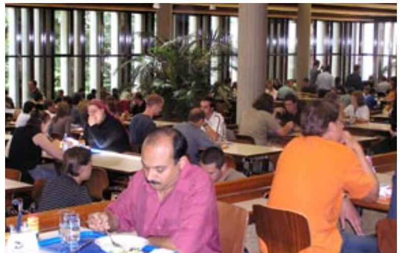
Der Betrieb in der Mensa Polyterrasse spürt die Abwanderung der Institute aus dem Zentrum auf den Hönggerberg.

Es scheint kein Weg zur Verpflegung mit Automaten in die HCI-Gebäude zu führen. Mirjam Sax und Elias Mulky haben sich mit den weiteren Mitgliedern der Arbeitsgruppe dieser Sisyphusarbeit angenommen und berichteten über ihre – bisher erfolglosen – Bemühungen um einen jederzeit zugänglichen Standort eines Getränke- und Verpflegungsautomaten. Die Arbeitsgruppe wird an der nächsten Sitzung über die weiteren Schritte und auch über einen Mensenvergleich und die Überarbeitung des Gastrokonzepts der ETH informieren.