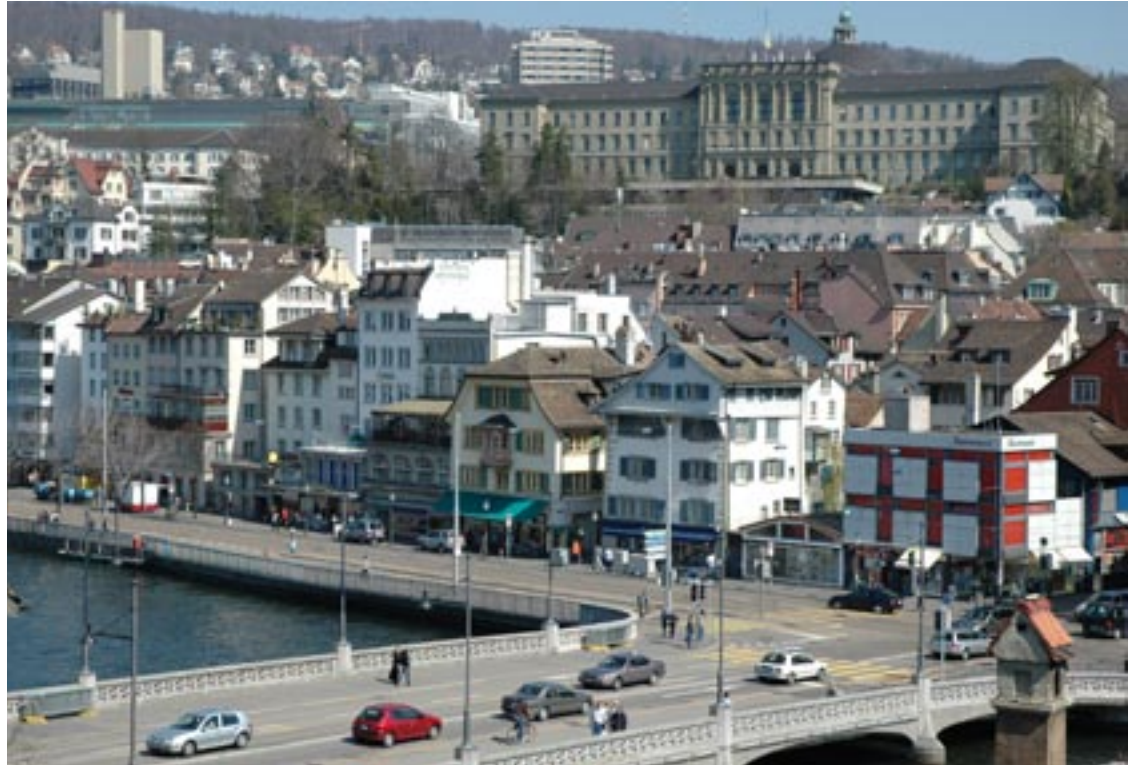
Die ETH ist ein Teil der Stadt Zürich und feiert deshalb auch ihr Jubiläum mit der Bevölkerung der Stadt.

Selektion war das Thema der ETH-Lehrmeistertagung im Forsthaus