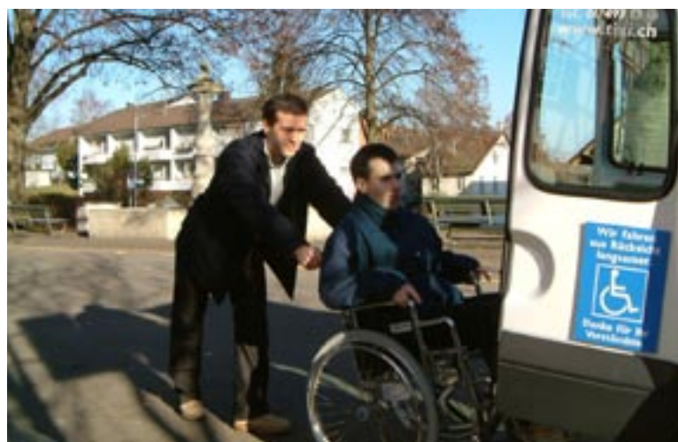
Ziel der PeKo ist – in Anlehnung an das 150-Jahr-Jubiläum – bei den ETH-Angehörigen innert 150 Tagen 150'000 Franken für den ausgewählten Empfänger – Tixi Transportdienst für Behinderte, Zürich – zu sammeln.

Selbstverständliches wie Schulbesuche oder der Besuch von Vorlesun-