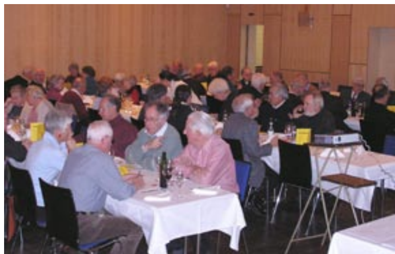
Nicht nur Wandern steht auf dem Jahresprogramm. Die «junggebliebene, alte Garde» der ETH ist eine solidarische kleine Gemeinschaft, die sich gegenseitig hilft, sich privat und zu den geselligen Anlässen trifft.