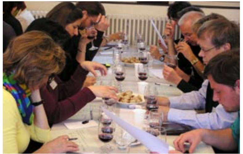
Die Lehrmeister stiegen mit einem Degustationswettbewerb in das Thema «Selektion» ein.

Das Thema liess für die Arbeit in den Gruppen viel Spielraum, der auch weidlich genutzt wurde.