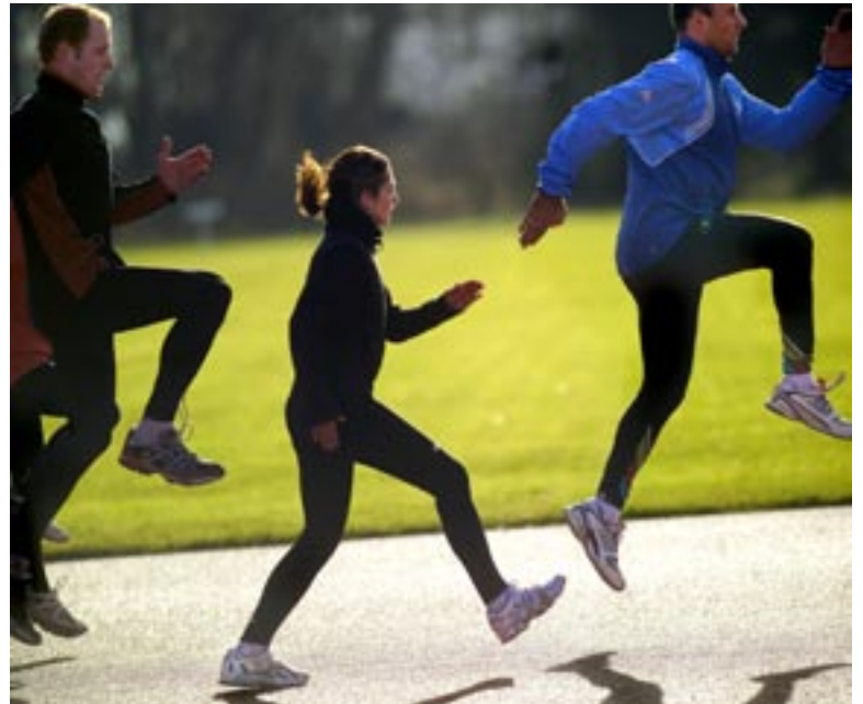
In der Laufschule auf der Fluntern wird fleissig für die verschiedenen Anlässe trainiert.

Zur Vorbereitung bietet der ASVZ die verschiedensten Trainingsgefässe und Lauf-Events an – ob Beginner, Fortgeschrittene oder Könner. Zum Trainieren steht an fünf Tagen in der Woche ein grosses laufspezifisches Angebot zur Verfügung, vom Testing, Circuit-Training über die Laufschule bis zum Long Jogg. An den montäglichen Testings mit Pulsmesser und Uhr kann die Leistungsfähigkeit ermittelt und der